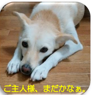
ご主人様、まだかなあ。