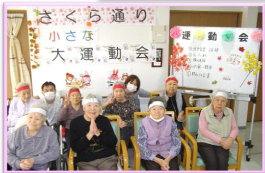
さくら通り 小さな大運動会