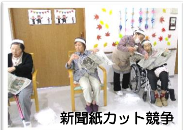
新聞紙カット競争