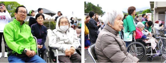
ステージ企画 楽しんでいただけましたでしょうか(?)