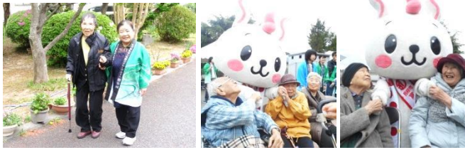
あの『べっぴん』も遊びに来てくれました(#^_^#)