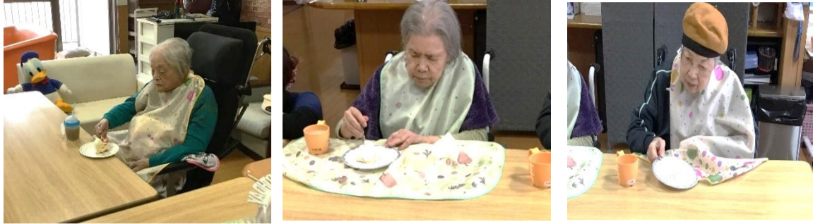
ケーキは切り分けて皆様といただきました