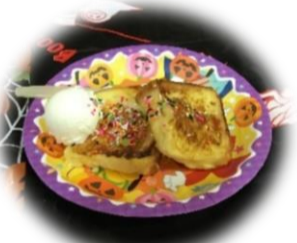
おやつにぴったりのフレンチトースト