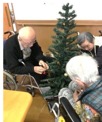
事前に皆様に飾り付けをしていただきました