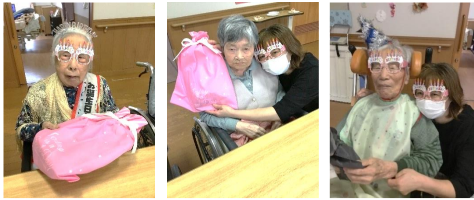
プレゼントは何をもらったのか気になります