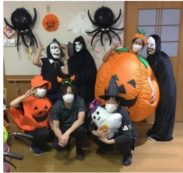
今年の仮装も気合を入れました