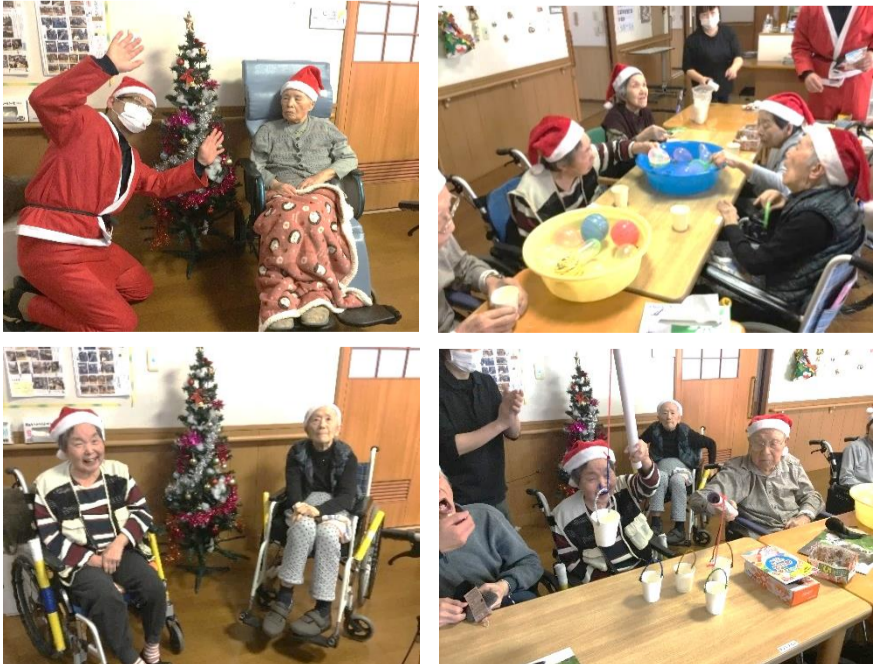
帽子がかわいらしいです