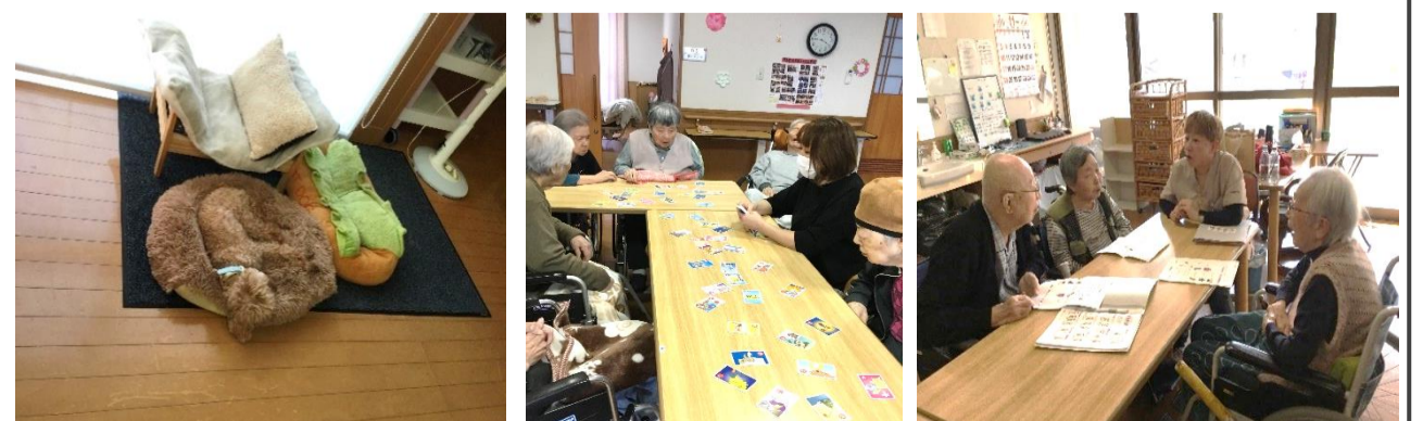
えんちゃん 見事に同化してます(笑)