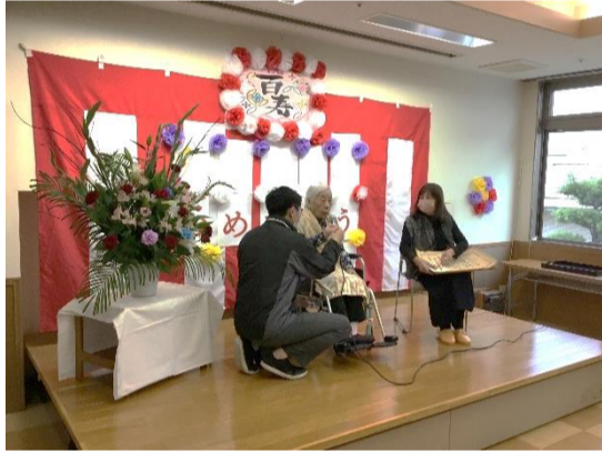
利用者様もお祝いにお越しいただきました