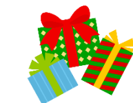
ご家族から届いたプレゼントに大喜び♪