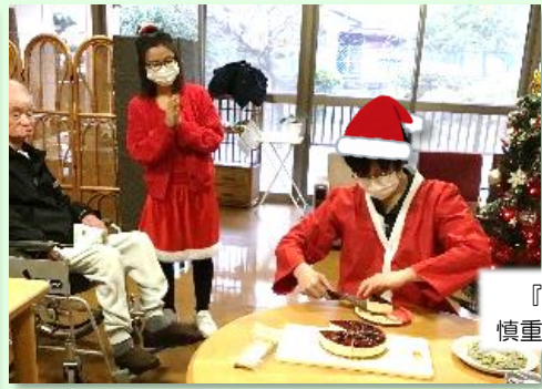
『手作りケーキ』 慎重に切り分けています