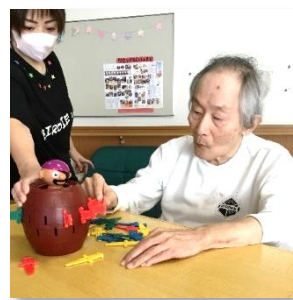
絶対負けんけんー