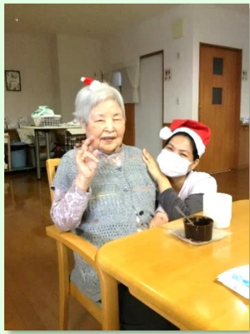
『ケーキが美味しかったよ』