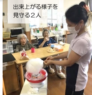
出来る様子を見守る2人