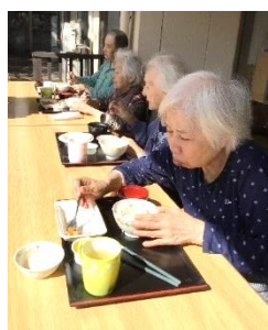
ベランダでランチ

晴天に恵まれて迎えた二〇二三年。早朝に目が覚めて、初日の出の時刻まではまだ余裕と台所でバタバタしていると辺りが明るくなってしまい、慌てて外を見ると太陽はすっかり地平線より高い位置にありました。年始早々やってしまった。テレビをつけるとダイヤモンド富士の映像が流れていました。映像からも、澄み渡る空気と神々しさが伝わり、直接初日の出を拝む事はできませんでしたが、年始に相應しい清らかな気持ちになりました。 さて、今年も昨年に引き続き感染対策等、皆さまのご協力をいただきながら進めてまいります。 本年も、何卒宜しくお願い申し上げます。