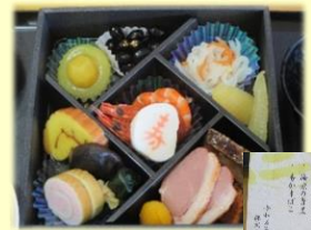
おせち料理も大変喜ばれていました。