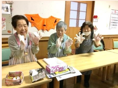
お月見に因んで、お豆腐白玉をつくり、お芋ムースにトッピング♪ お母さま方は団子をこねるのに大張り切りでした！ お芋ムースは職員が手作りました♡