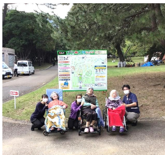
『久しぶりに外の空気を吸って気分もリフレッシュ!』