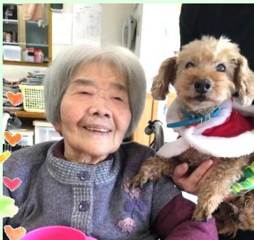
えんちゃんもクリスマスのコスチュームで大活躍！