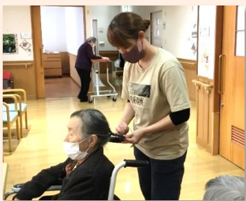
いつも職員の服を「かわいいね」と褒めてくださるおしゃれ好きなご利用者様とヘアメイクを楽しみました♡ にっこり笑顔で「またしてな〜」と言われていました。