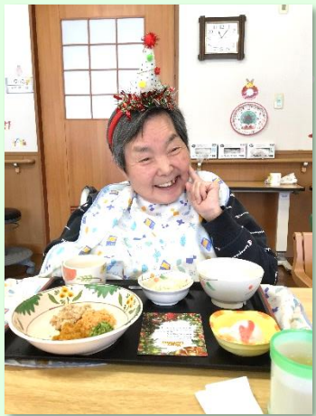
『クリスマスメニューにニコリ』