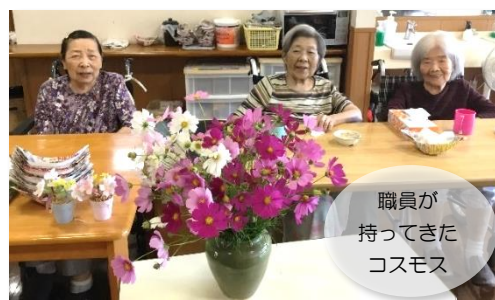
職員が持ってきたコスモス