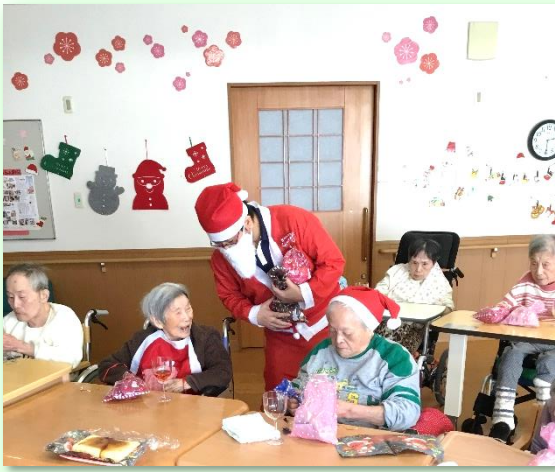
『やっぱりプレゼントは嬉しいな』

また、職員の衣装やクリスマスソングのBGMも雰囲気を出し、最後に職員が選んだプレゼントをお渡しすると、皆さま大喜ばれていました。笑顔がたくさんあったクリスマス会でした。