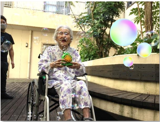
シャボン玉 童心にかえて笑顔がこぼれます