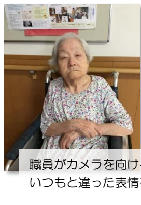
職員がカメラを向けるとポーズをとられいつもと違った表情を見せて下さいます