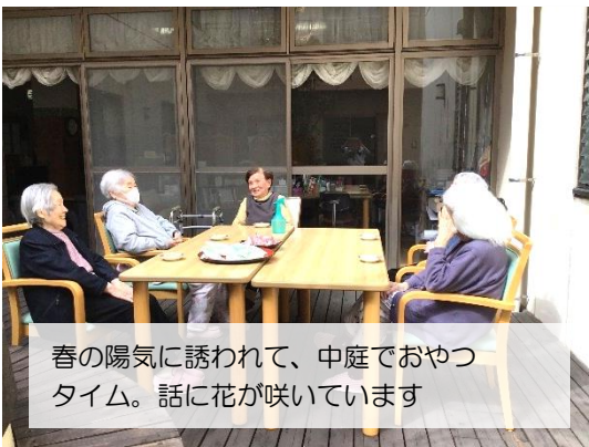
春の陽気に誘われて、中庭でおやつタイム。話に花が咲いています