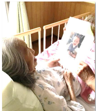
ひ孫の写真に表情が緩みます