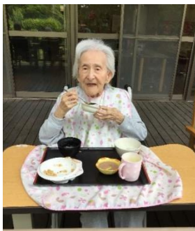
天気の良い日にデッキで昼食