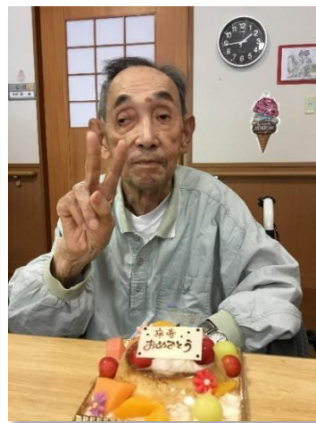
90歳のお誕生日を迎えてご家族から届いたケーキに御満悦の様子