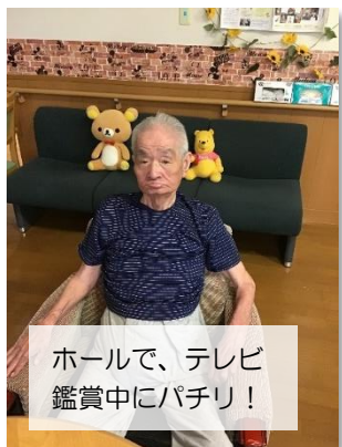
ホールで、テレビ鑑賞中にパチリ!