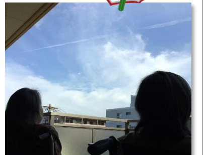
日光浴。偶然にも、青空に飛行機雲が。「うわ〜偶然やな!」「すごいな」との声が。