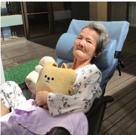
お風呂上りに中庭で涼みました