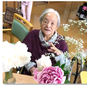
ご家族様から届いた生花。顔を近づけて、「いい匂いがするね」と終始笑顔で話されていました。