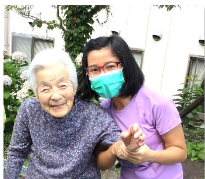
ご利用者と敷地内を散歩