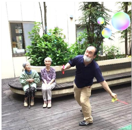
職員もつい夢中に