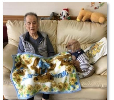
えんちゃんといっしょ