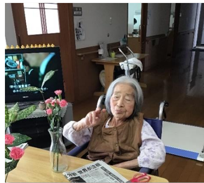
毎月第2水曜日は、生花クラブの日です。季節の花を思い思いに生けて頂きます。