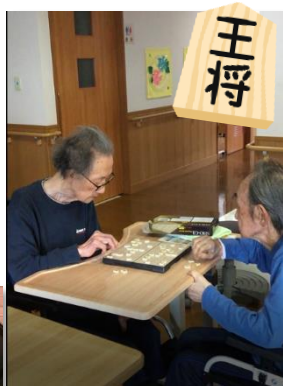
負けられない戦い