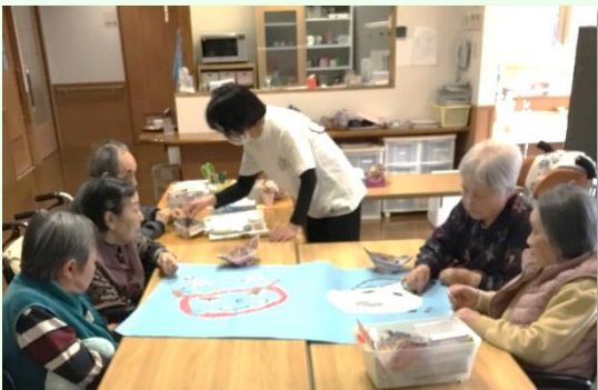
紙をちぎって貼り付ける根気のいる作業ですが、毎月、素晴らしい作品が完成し、職員も楽しみにしています。