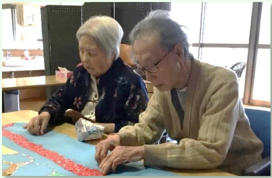
真剣な表情で取り組まれています。