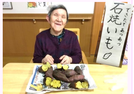
おやつに『石焼いも』を作りしました。部屋中においしい香りが広がりました。