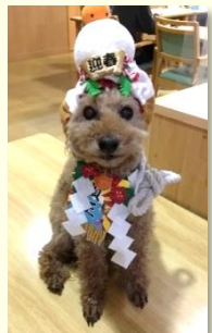
今年もよろしくお祈りします

新年、明けましておめでとございます。年明けとともに流れる感染者増大のニュースにいつになつたら友人たちと会えるのだろう、いつになつたら心置きなく出かけられるのだろう、いつになつたら・・・と半ばあきらめにも似た残念な気持ちになりました。今年ほどどんな年になるのかな、いや、どんな年にしたいのかな。どうにもならない事を悶々と考えるのはやめて『笑門』には福来る『精神』で、口角をあげて過ごしたいものです。(それも当分はマスクの中ですが) 感染防止対策として、面会の制限と緩和を繰り返すこと2年。ご家族にとってもなかなか終息しないコロナ禍にご不便をお掛けしております。今月より、3回目のワクチン接種が始まりますが、引き続きご協力頂きます様、宜しくお願い申し上げます。