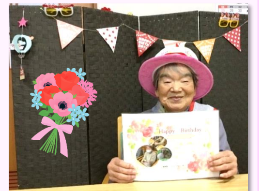
ご利用中にお誕生日を迎えられました。