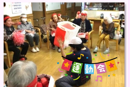
『運動会』を行いました。玉入れやパン食い競争などを行い、よい運動になりました。