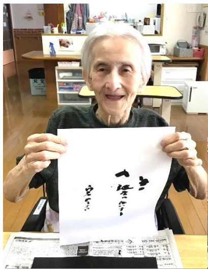
姿勢よく、思いのままに筆を走らせて、出来上がりにニッコリ

静かに広がる青い空、天気にも恵まれ、大変気持ちのよいお正月を迎えました。元旦の朝食には『おせち料理』を準備しました。素材や料理の一つ一つに願いの込められた御祝い膳。皆様美味しそうに召し上がっていました。