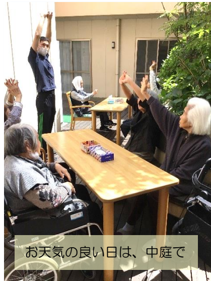
お天気の良い日は、中庭で