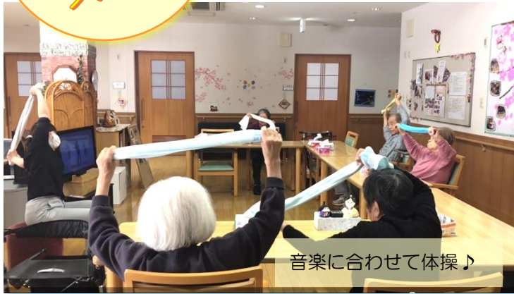
音楽に合わせて体操♪