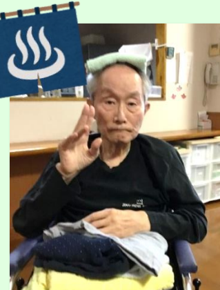
これから入浴タイム