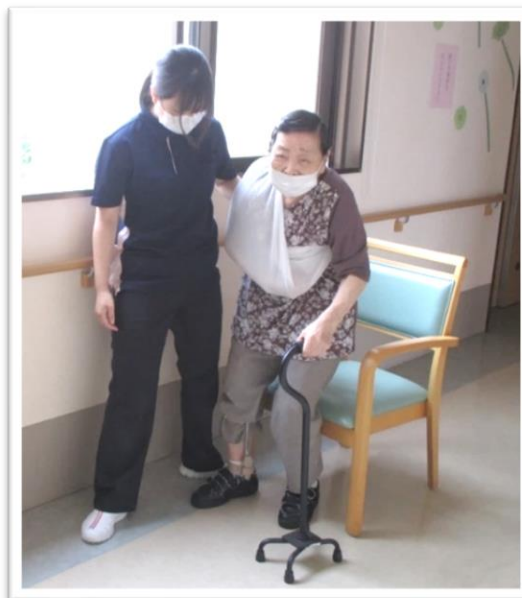
「1, 2, 3, 4...」と声を掛け合いながら、楽しそうに歩行訓練をする様子

皆様に「リハビリの時間が待ち遠しい」と思われるような楽しいリハビリが出来るように頑張りますので、宜しくお願い致します。