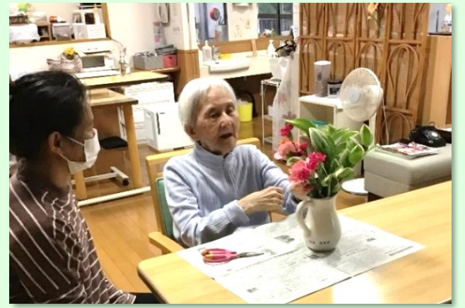
月に1度の生花の時間