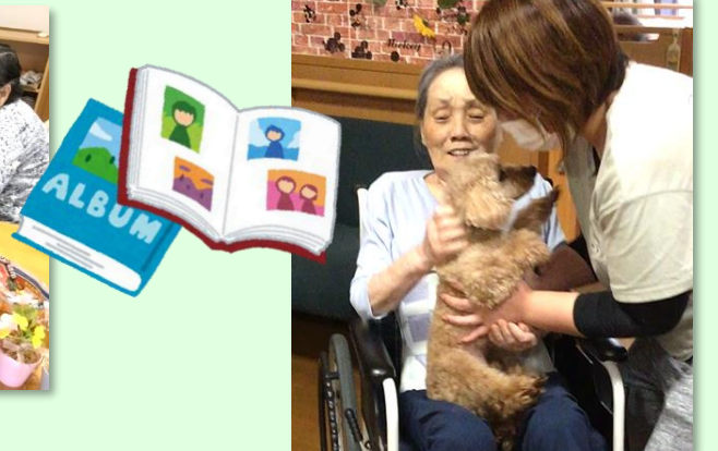
えんちゃんにも徐々に慣れて頂いています。