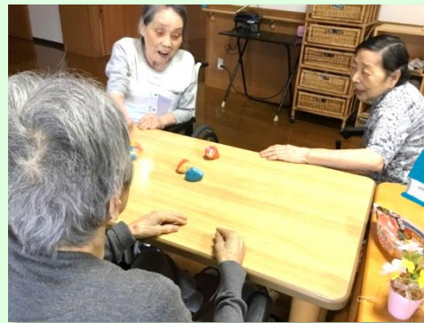
『お手玉』懐かしいですね