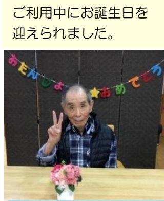
ご利用中にお誕生日を迎えられました。