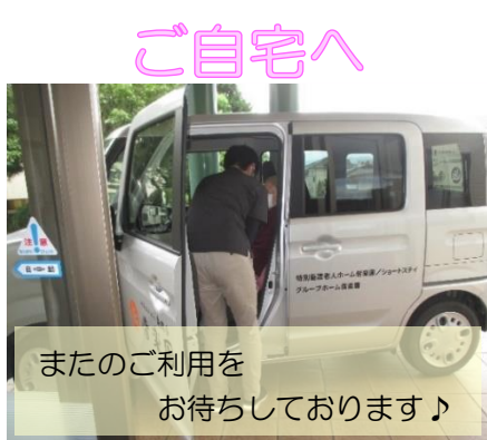
またのご利用をお待ちしております♪