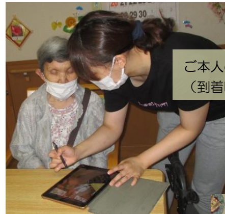
ご本人の写真撮影とお荷物チェック（到着時の服装や持ち物を記録）