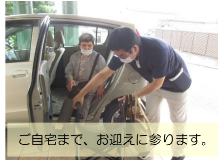
ご自宅まで、お迎えに参ります。