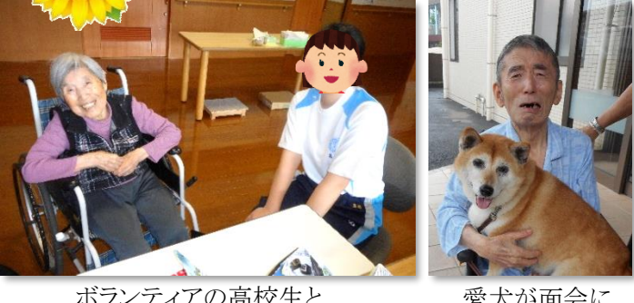
ボランティアの高校生と 愛犬が面会に