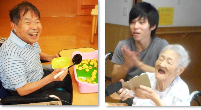
レクリエーション(魚すくいや射的など)