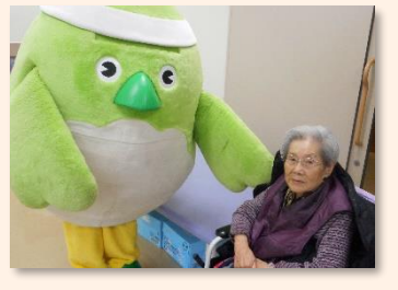
「めじろん」といっしょ