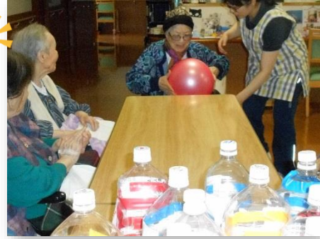
さあ、しっかり狙って投げましょう!