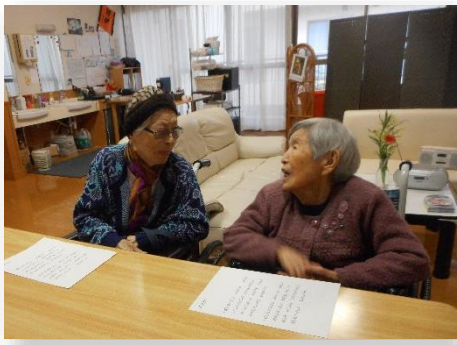
おしゃべりに花が咲きます

作業療法士による機能訓練 を兼ねたレクリエーションで が、普段、別々のユニットで 生活しているご利用者同士、 楽しい交流の場にもなってい ます。