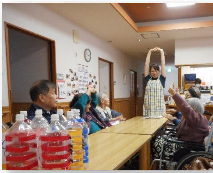
準備体操を入念に